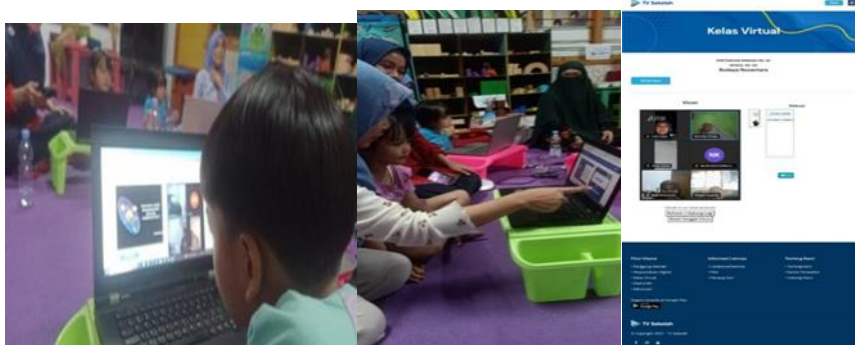
Gambar 5. Suasana Pembelajaran dengan Kelas Virtual TV Sekolah (CL. 2)

Berdasarkan CL 1, terlihat bagaimana tampilan modul ajar di kelas virtual yang bisa jadi materi pembelajaran guru dan para siswa. Materi yang beragam dengan tampilan yang menarik. Kelas virtual yang menarik dan beragam mampu meningkatkan kreativitas dan kemampuan bahasa guru dan murid. Pengucapan kosakata yang jelas dan intonasi yang tepat saat menyampaikan materi, baik dalam modul maupun di kelas virtual, akan menjadi contoh bagi murid. Pembelajaran dengan teknologi seperti TV virtual membuka peluang inovasi dan kreatifitas dalam mengembangkan pola pikir siswa. TV virtual juga memungkinkan murid untuk belajar di mana dan kapan saja, menjadikannya sistem pembelajaran yang efektif dan fleksibel (Ristiyana et al., 2023). Adanya ruang Vicon, membuat interaksi antara guru dan murid bahkan juga dengan orang tua/pendamping anak/murid.