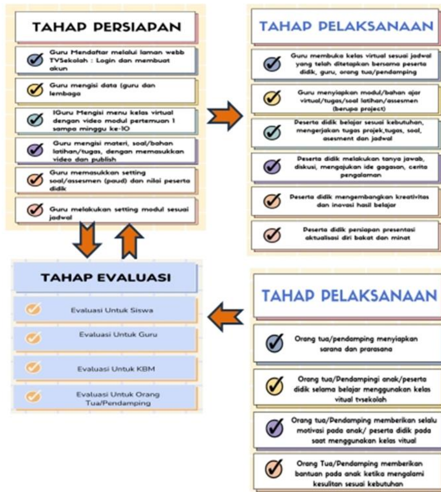
Gambar 2. Konsep Pengembangan Kelas Virtual TV Sekolah (Watini, 2023) (CD. 2)

Berdasarkan CD 2, Ada tahapan persiapan, tahap pelaksanaan dan tahap evaluasi. Tahap Persiapan meliputi : guru mendaftar melalui laman web TV Sekolah : Login dan membuat akun. Kemudian guru mengisi data guru dan lembaga. Selanjutnya guru mengisi menu kelas virtual dengan video modul pertemuan 1-10. Kemudian guru mengisi materi, soal/bahan, latihan/tugas, dengan memasukkan video dan publish. Selanjutnya guru memasukkan setting soal/assesmen PAUD dan nilai peserta didik. Dilanjutkan dengan guru melakukan setting jadwal. Pada Tahap Pelaksanaan guru membuka kelas virtual sesuai jadwal yang sudah ditetapkan bersama peserta didik, guru, orang tua/pendamping. Guru menyiapkan modul/bahan ajar virtual/tugas/soal latihan/assesmen berupa project. Peserta didik belajar sesuai kebutuhan mengerjakan tugas projek, soal/assesmen, dan jadwal. Peserta didik melakukan tanya jawab, diskusi, mengajukan ide gagasan dan cerita pengalaman. Peserta didik mengembangkan kreasi dan inovasi hasil belajar. Peserta didik melakukan persiapan aktualisasi dari bakat dan minat. Pada Tahap Pelaksanaan orang tua/ pendamping menyiapkan sarana dan prasarana. Orang tua/pendamping peserta didik selama belajar menggunakan kelas virtual per sekolah. Orang tua/pendamping peserta didik memberikan motivasi kepada anak/peserta didik, memberi bantuan kepada anak ketika mengalami kesulitan sesuai kebutuhan. Selanjutnya adalah tahap evaluasi. Evaluasi terhadap guru, anak, KBM, dan orang tua/pendamping.